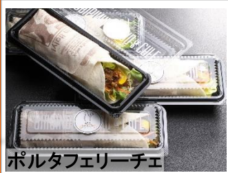
ポルタフェリーチェ