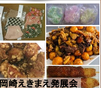
岡崎えきまえ発展会