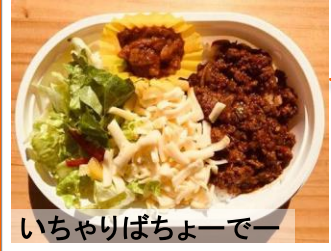
いちやりばちよーでー